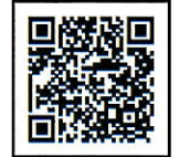
違反対象物公表制度